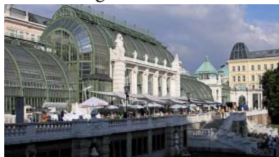
Hofburg mit Palmenhaus