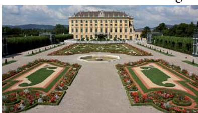
Schönbrunn - Gartenanlage